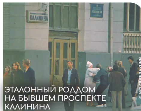
ЭТАЛОННЫЙ РОДДОМ НА БЫВШЕМ ПРОСПЕКТЕ КАЛИНИНА

Нашему району не привыкать быть лучшим для малышей. Ведь здесь, на Новом Арбате в домах № 5 и 7, находился знаменитый на всю столицу родильный дом имени замечательного акушера-гинеколога Г.Л. Грауэрмана.