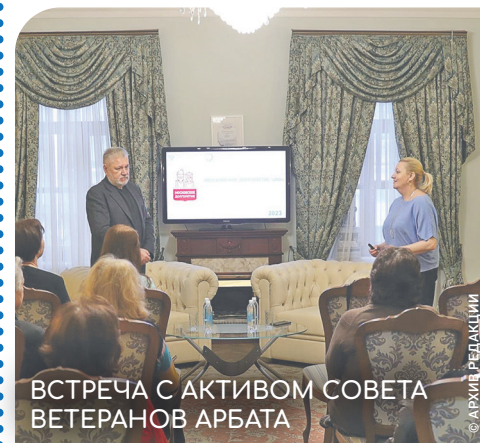
ВСТРЕЧА С АКТИВОМ СОВЕТА ВETERANОВ АРБАТА

Проекту Мэра Москвы для активных москвичей старшего поколения «Московское долголетие» — 5 лет! За эти годы он изменил жизнь многих его участников: помог исполнить мечты молодости, найти друзей, новые увлечения и радости, развеяв стереотипы о возрасте.