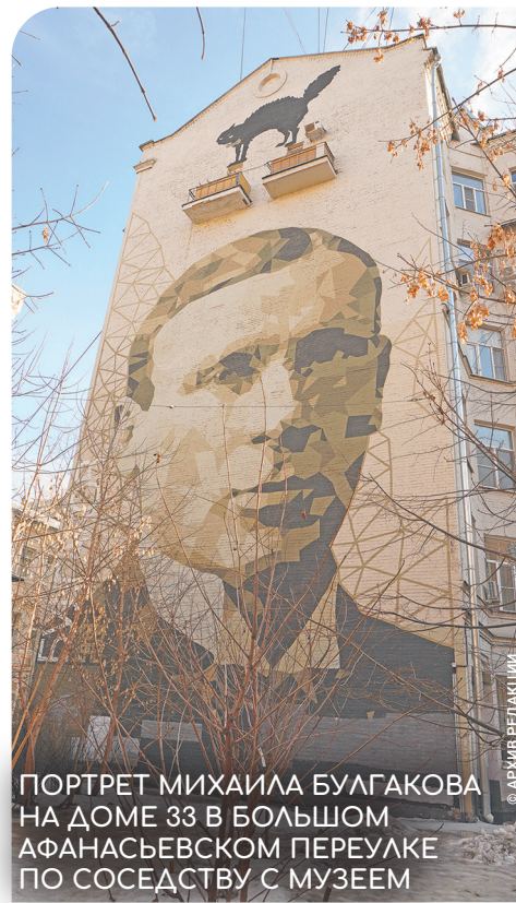
ПОРТРЕТ МИХАИЛА БУЛГАКОВА НА ДОМЕ 33 В БОЛЬШОМ АФАНАСЬЕВСКОМ ПЕРЕУЛКЕ ПО СОСЕДСТВУ С МУЗЕЕМ